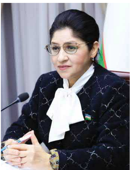
Малика ҚОДИРХОНОВА, Олий Мажлис Сенатининг Хотин-қизлар ва гендер тенглик масалалари қўмитаси раиси, Ўзбекистон ХДП аъзоси:

— Сўнги йилларда мамлакатимизда амалга оширилаётган ислохотларнинг барчасида инсон қадр ва халқ манфаатлари ҳамма нарсдан устун бўлиши аниқ кўрсатиб берилганини кўриш мумкин.